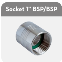
Socket 1" BSP/BSP