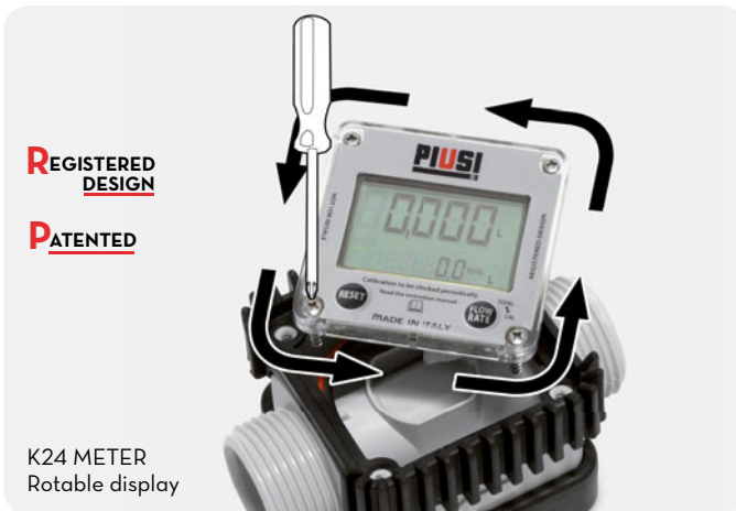
K24 METER Rotable display