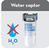
Code: R12738000 (Key lock not included)